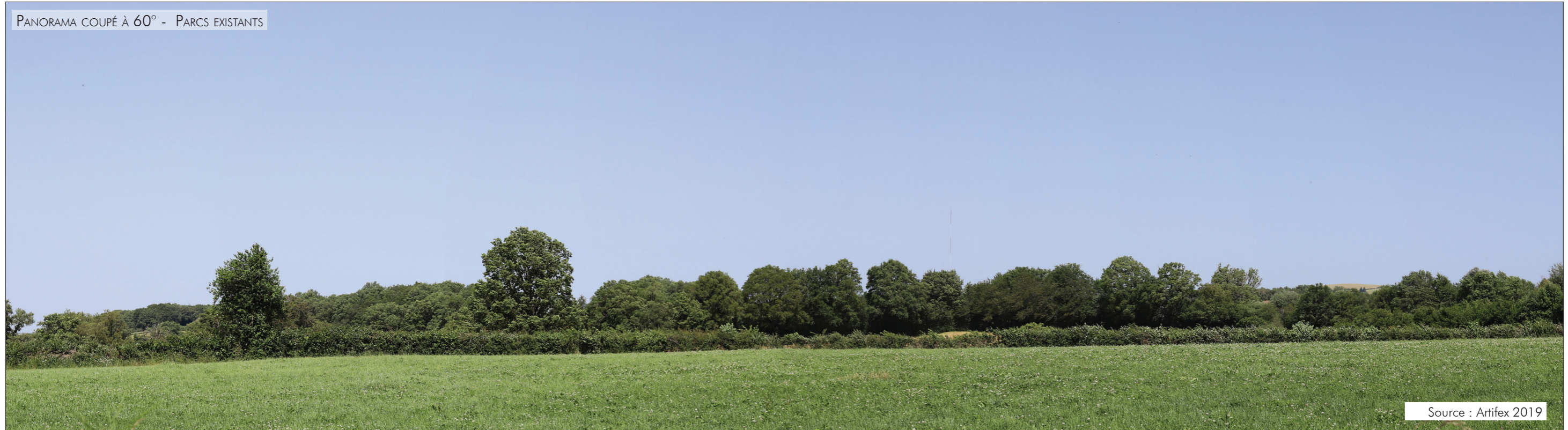
PANORAMA COUPÉ À 60° - PARCS EXISTANTS