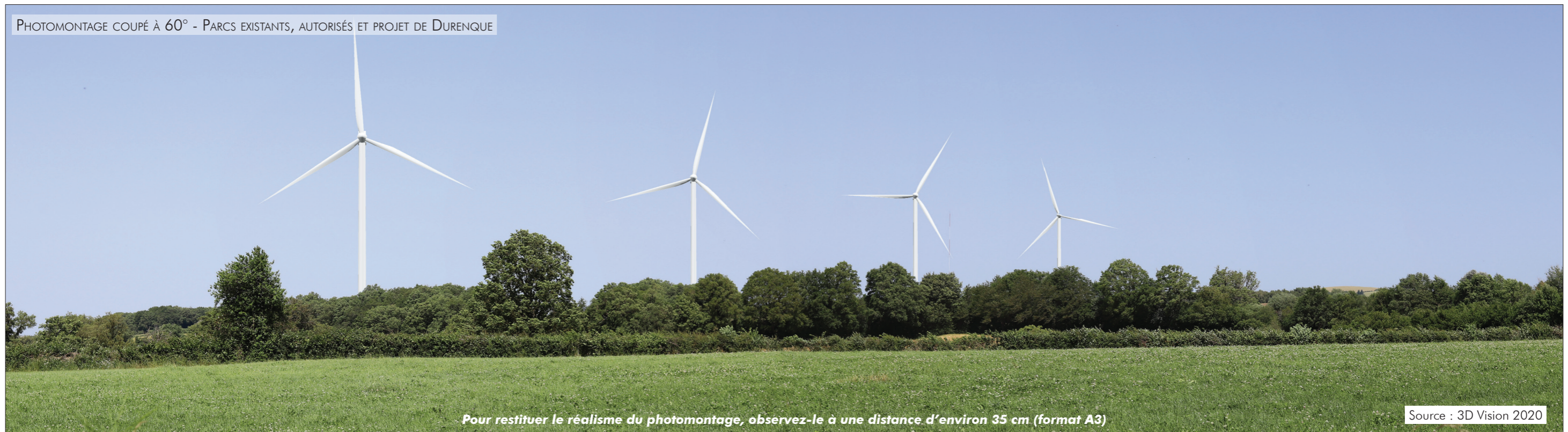
PHOTOMONTAGE COUPÉ À 60° - PARCS EXISTANTS, AUTORISÉS ET PROJET DE DURENQUE

Pour restituer le réalisme du photomontage, observez-le à une distance d'environ 35 cm (format A3)